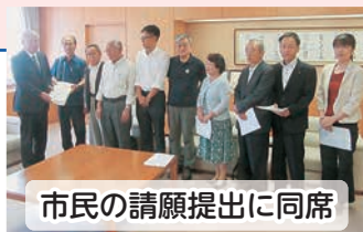
市民の請願提出に同席

国保税は3年連続で増税され、「収入の1割ちかくも取られる」と悲鳴が上がっています。国保会計は毎年黒字で、基金は約19億円もあります。国保税を引き下げるべきです。