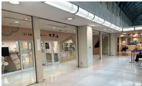
ネウボラセンターが設置される天満屋のフロア