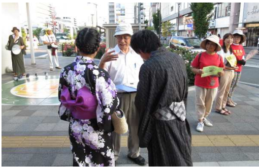
ゆかた姿で署名に応じる人も

7月25日午後6時から、福山駅前「STOP! 戦争へへの道」福山総がかり行動」が展開され、100名を超え